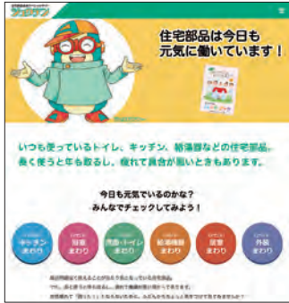
図2 『自分で点検! ハンドブック』と「ジュウテン」サイト

上『自分で点検! ハンドブック』の内容(一部)。右ページの表ではアイコンを使って、故障を放置した場合の危険度を示している